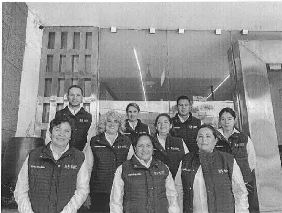
Programa FAM, Michoacán

La presente Guía Operativa de Contraloría Social del Programa Fortalecimiento a la Atención Médica S200 en el marco de los Comités Locales de Salud, se elabora en apego y cumplimiento al Acuerdo por el que se establecen los Lineamientos para la promoción, operación y seguimiento de la Contraloría Social en los programas federales de desarrollo social 1 , y a la Estrategia Marco elaborada por la Unidad de Operación Regional y Contraloría Social de la Secretaría de la Función Pública (UORCS). 2