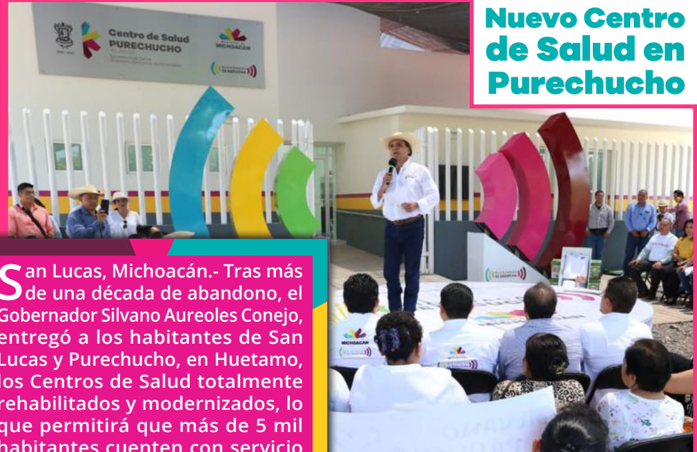
Nuevo Centro de Salud en Purechucho